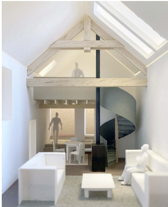
Plan de coupe